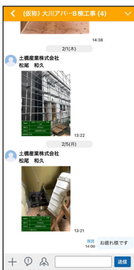
▲施工管理アプリ「Kizuku」の画面

案件管理についても施工管理アプリ「Kizuku u」を導入して、社内浸透を図りました。導入前は上 手く活用されるか不安もありましたが、チャットツ ールのように簡単に案件の進捗が管理できるので、社員 にとっても使いやすいようです。